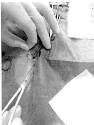
Paciente felina con cuerno uterino atrofiado de menor tamaño.