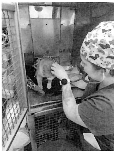
Monitorizando paciente felino post cirugía.