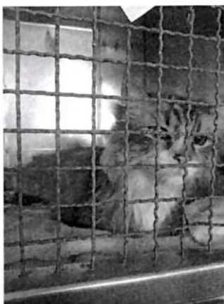
Paciente felino recuperándose tranquilo de su cirugía.